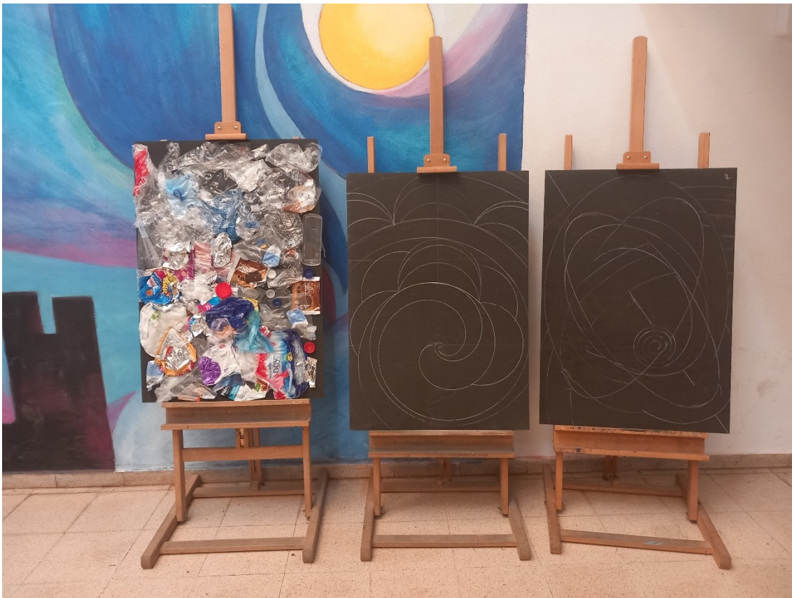
Inicio del grapado de los plásticos en los murales de madera.