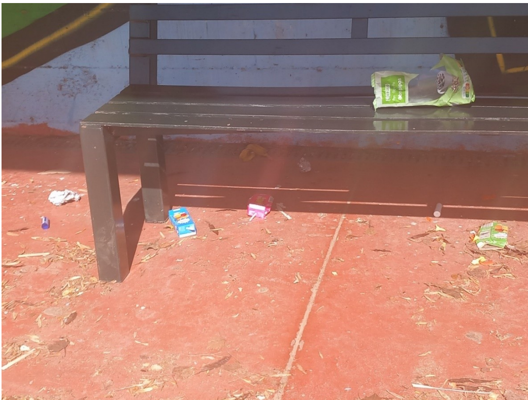
Aspecto del patio tras el recreo, con numerosos envases tirados por el suelo.

Pedimos colaboración al Departamento de Dibujo del IES. Proponen concienciar al alumnado durante una sesión en el aula y posteriormente comenzar a realizar unos murales para visibilizar los desechos que se producen y que además quedan fuera de los contenedores.