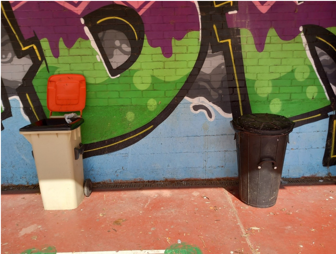
Disposición de los únicos dos contenedores del patio.